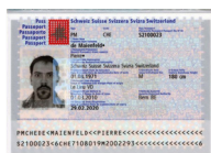
Passeport Copie de la page avec votre photo et votre signature