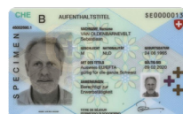
Autorisation de séjour Copie recto verso

Veillez envoyer la copie d'une pièce d'identité avec la demande à: