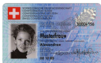
Carte d'identité Copie recto verso