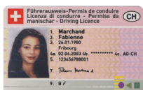
Permis de conduire Copie recto