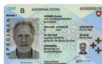
Permesso di dimora Copia fronte e retro

Si prega di inviare la copia del documento d'identità unitamente alla richiesta al seguente indirizzo: Cornèr Banca SA Succursale BonusCard (Zurigo) Casella postale 8021 Zurigo