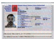
Passaporto Copia della pagina con la foto e la firma