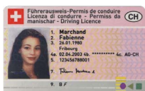
Licenza di condurre Copia fronte