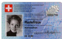
Carta d'identità Copia fronte e retro