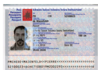
Passeport Copie de la page avec votre photo et votre signature