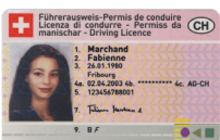
Licenza di condurre Copia fronte