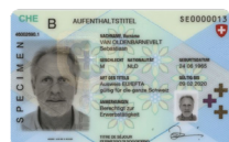
Permesso di dimora Copia fronte e retro

Si prega di inviare la copia del documento d'identità unitamente alla richiesta al seguente indirizzo: Cornèr Banca SA Succursale BonusCard (Zurigo) Casella postale 8021 Zurigo