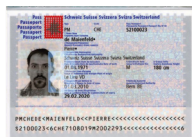
Passaporto Copia della pagina con la foto e la firma