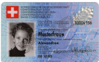
Carta d'identità Copia fronte e retro